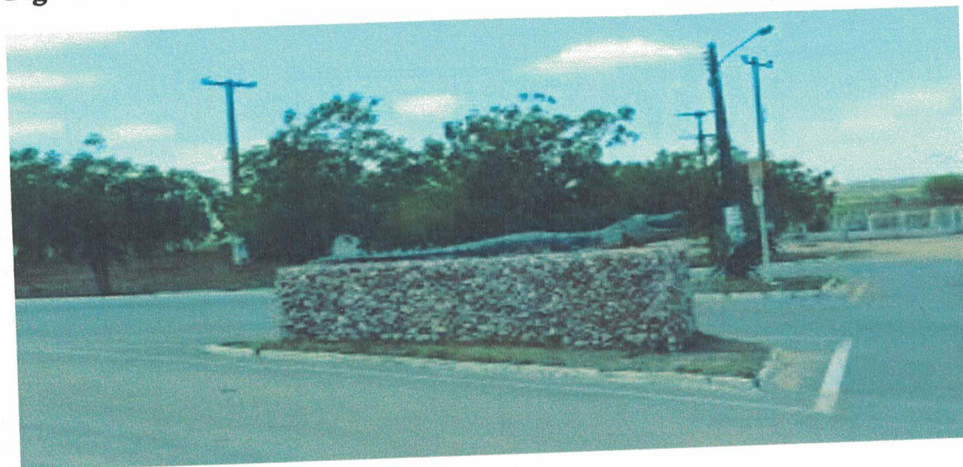
Figura 01- Símbolo da Cidade