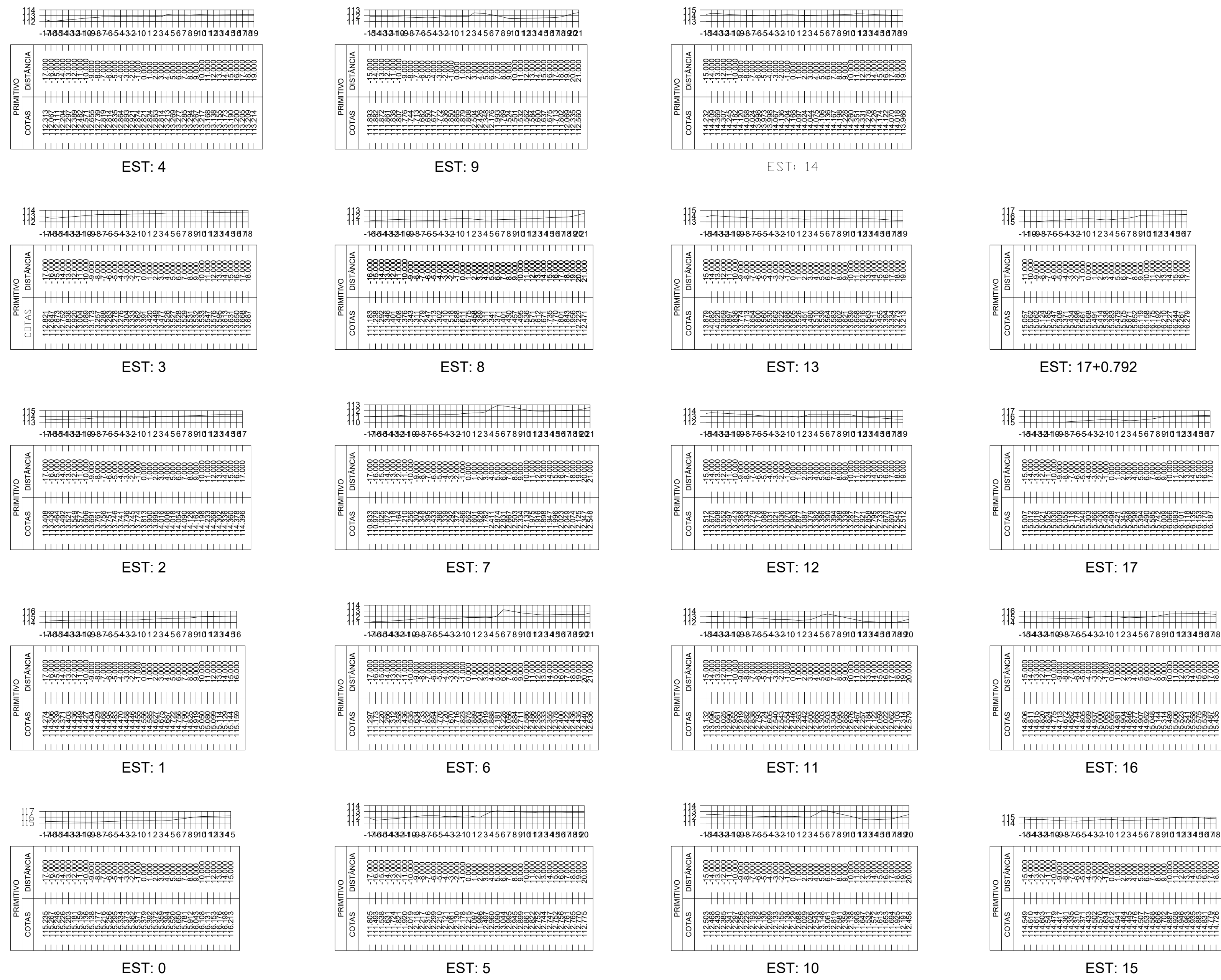
Secções Transversais da Estrada Vicinal Escala Horizontal - 1/500 Escala Vertical - 1/500